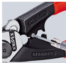
напрессовка концевой гильзы на тяговый трос