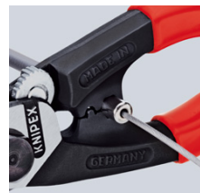
напрессовка наконечника на боуденовский трос